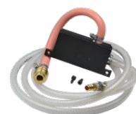
Eiettore ad aria compressa

Tutte le informazioni possono essere soggette a modifiche senza alcun preavviso. 20.10